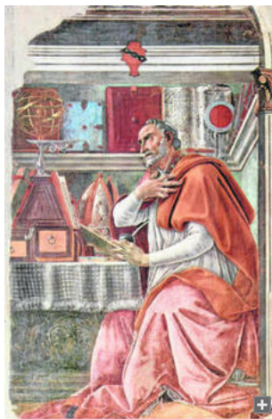
'San Agustín en su gabinete', un fresco de Botticelli ubicado en la iglesia Ognissanti de Florencia.