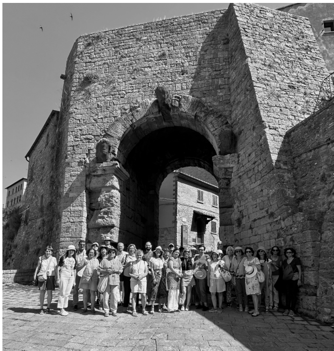
FIGURA 1.2: El grupo ante la Puerta del Arco, Volterra