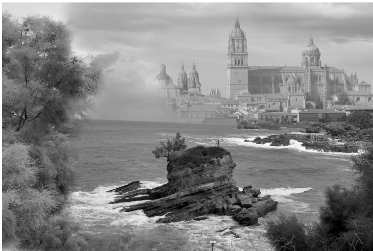
Un mar de Santander para la catedral de Salamanca, entre hojas de tamariz.

Estudiante de Filología Clásica y Lingüística (UCA)