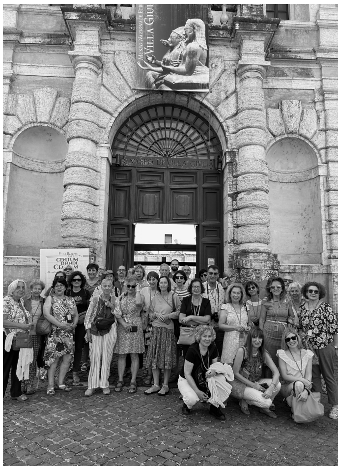
FIGURA 1.1: El grupo ante Villa Giulia