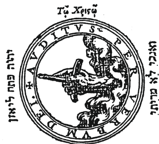
Instituto de Humanismo y Tradición Clásica