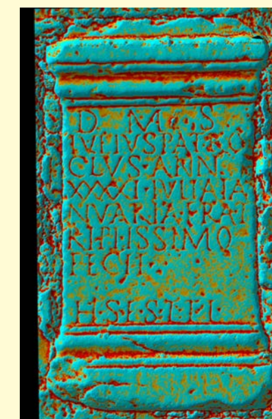
Inscripción funeraria de Augusta Emerita, Mérida, Badajoz, con técnica M.R.M. CIL II 565.