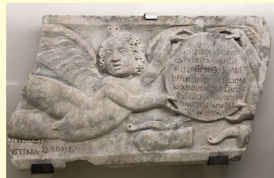
Fragmento de sarcófago, Terme di Diocleziano, Museo Nazionale Romano, Roma, Italia. CIL VI 10221.

La exposición “ Siste, viator : la epigrafía en la antigua Roma” pretende mostrar qué es la epigrafía, sus usos e importancia en el mundo romano, su utilidad para la investigación histórica y cómo esta se ha desarrollado en el pasado y en el siglo XXI. Se enfoca de manera divulgativa y para todos los públicos con el fin de acercar al visitante a la sociedad y vida cotidiana romanas a través de las inscripciones. Para ello, el usuario podrá contemplar fotografías de muy diversos epígrafes, piezas auténticas procedentes de distintos Museos y yacimientos de la península Ibérica, así como otros recursos y material de trabajo de los que se servía el epigrafista en el pasado y se sirve actualmente (calcos, reproducciones, monografías antiguas, corpus...). También, por medio de paneles explicativos, material audiovisual y recreaciones, el visitante recibirá, de manera clara y sencilla, información básica y útil para entender el mundo romano. Además de acercar al interesado a esta civilización, se busca concienciar al mismo de la importancia de estudiar y preservar el pasado material y, al mismo tiempo, insuflarle interés sobre la Antigüedad y, más particularmente, sobre los testimonios escritos.