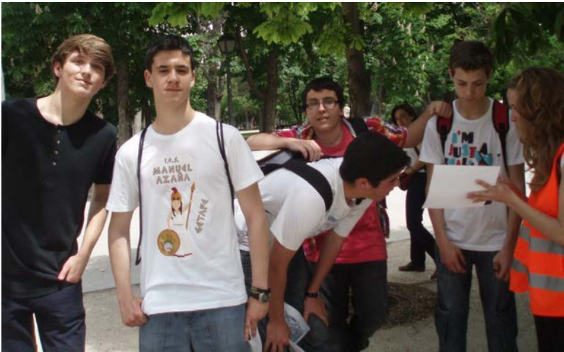
Jesús y los Argonautas resolviendo una prueba (I Gymkhana Mitológica)

Me ayudó, además, a reafirmarme en una decisión: Humanidades era mi lugar, sin duda. Nada me hacía tan feliz como aprenderme la genealogía de los Olímpicos o identificar a Dioniso en un ánfora. Prefería estar en esa gymkhana, recitando atributos de los dioses, a estar en una Olimpiada Matemática. Y esa máxima, la de la felicidad laboral, el dedicarme a lo que me gusta, ha sido algo que he seguido aplicando hasta hoy. No ha sido fácil, pero una mezcla de suerte, trabajo y apoyo familiar, ha hecho posible que hoy esté justo donde quiero estar y que muchos sueños, que nacieron el año de la gymkhana y en las clases de Cultura Clásica, se hayan cumplido 6 .