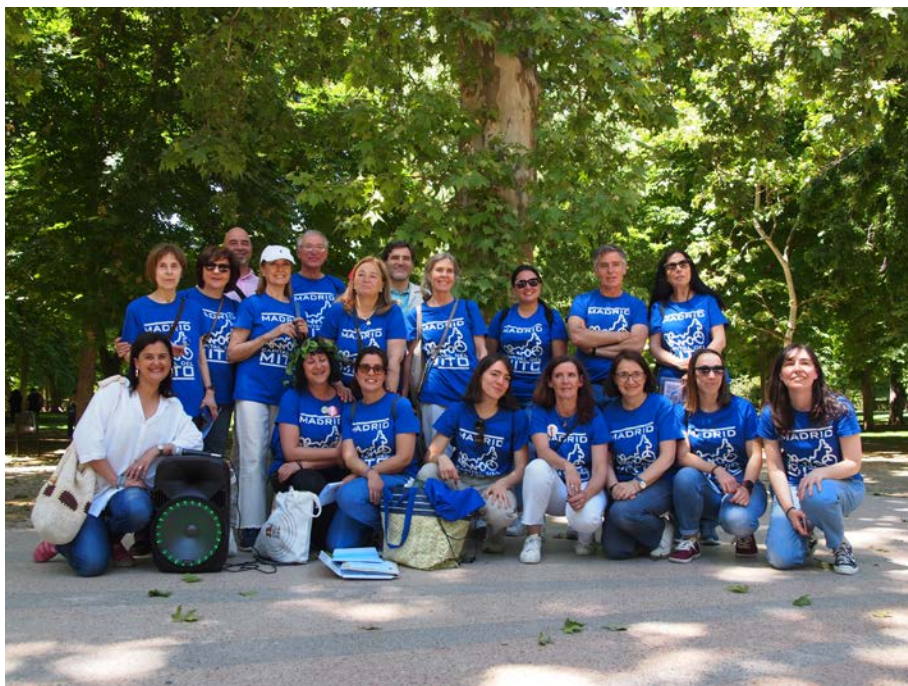
Miembros de Madrid, Capital del Mito en compañía de profesores de la UAM y la UCM (XIII Gymkana)