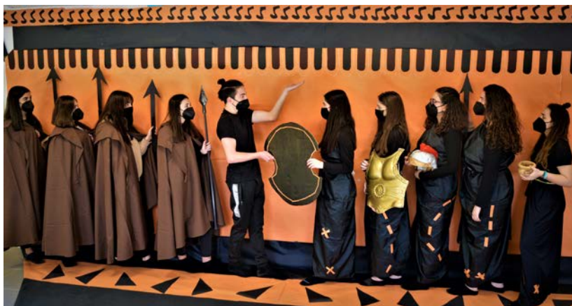
Recreación de una escena relacionada con la Guerra de Troya por el grupo Ariadnae filiae