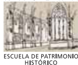
ESCUELA DE PATRIMONIO HISTÓRICO